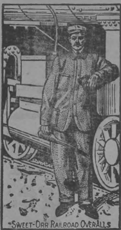
*SWEET-ORR RAILROAD OVERALLS