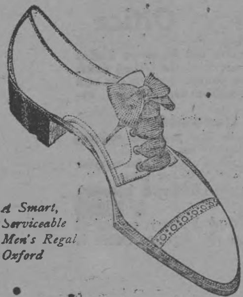
A Smart, Serviceable Men's Regal Oxford